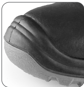
zesílená přední část proti okopu reinforced PU overcap nosek z PU wzmocněním