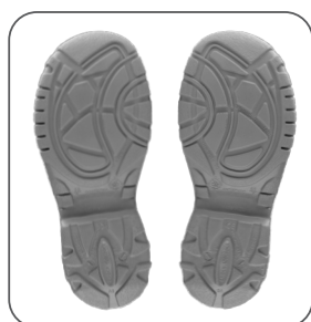
podešev outsole podeszwa