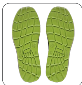
podešev outsole podeszwa