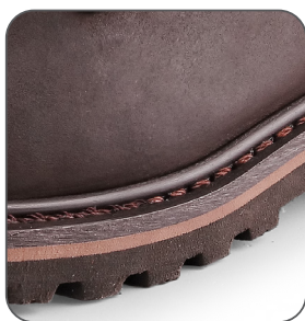
Goodyear prošitá podešev Goodyear welted outsole Goodyear przesyta podeszwa