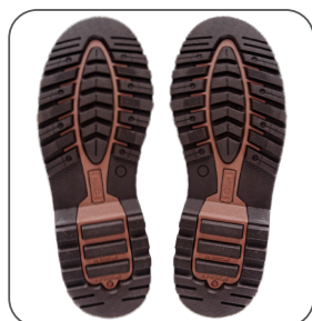
podešev outsole podeszwa