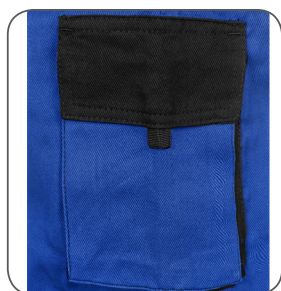
kapsa na mobil / peněženku pocket for mobile phone / wallet kieszeń na tel. kom. / portfel