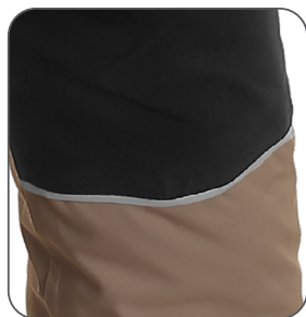
reflexní doplňky reflective accessories elementy odbłaskowe