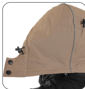
odepínací kapuce detachable hood odpinany kaptur