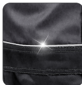
reflexní doplňky reflective accessories elementy odblaskowe