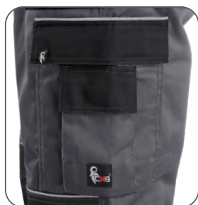
multifunkční kapsy multifunctional pockets kieszenie wielofunkcyjne