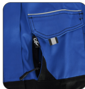
skrytá náprsní kapsa hidden chest pocket ukryta kieszeń na piersi