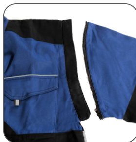
odepínatelné rukávy detachable sleeves odpinane rękawy