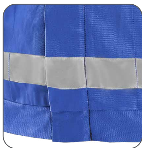
reflexní pruhy reflective stripes paski odblaskowe