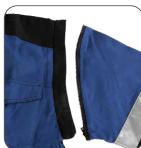
odepínatelné rukávy removable sleeves odpinane rękawy