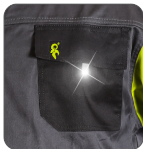
náprsní kapsa s klopou chest flap pocket kieszeń na piersi z patką