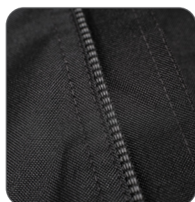
reflexní doplňky reflective accessories elementy odblaskowe