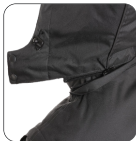
odepínací kapuce detachable hood odpinany kaptur