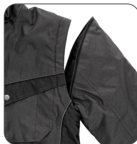
odepínací rukávy detachable sleeves odpinane rękawy