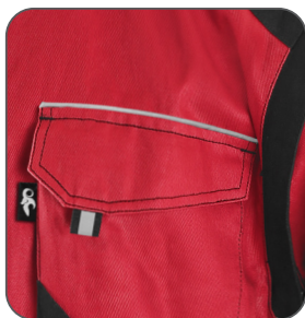
reflexní doplňky reflective accessories elementy odblaskowe