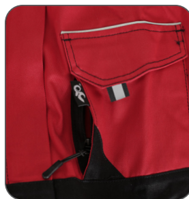
skrytá náprsní kapsa hidden chest pocket ukryta kieszeń na piersi